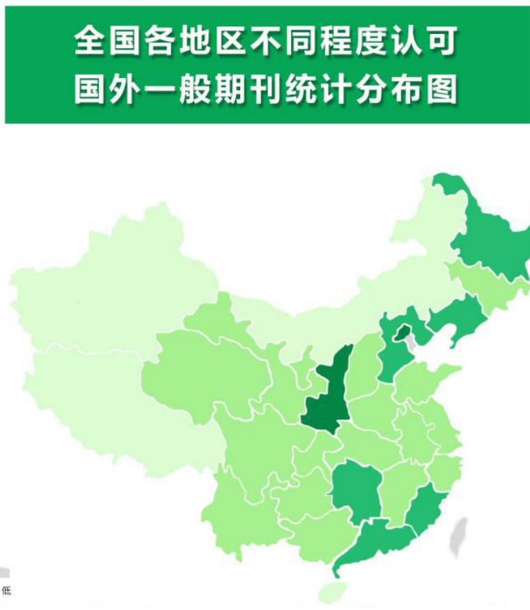
图 7 全国各地区不同程度认可国外一般期刊统计分布图